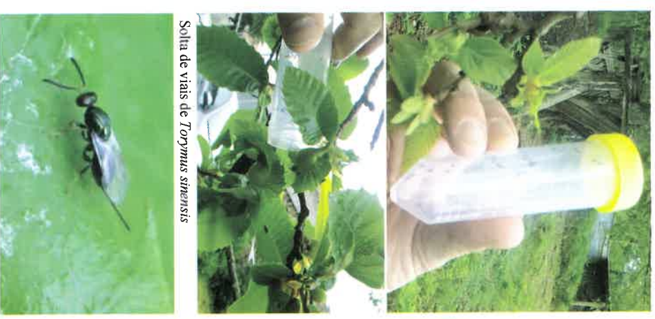
Solta de vias de Torymus sinensis

Existen ademais outros inimigos ocasionais e autóctonos da avespa que tamén atacan as bugallas dos castiñeiros e poden axudar ao control.