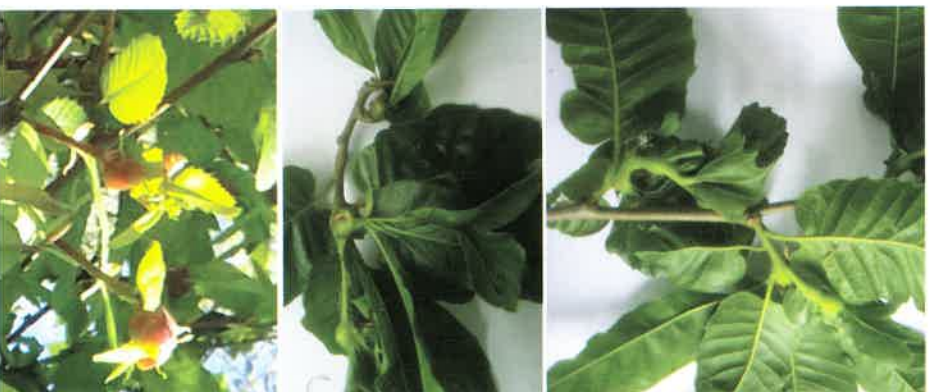
Evidencias de danos: bugallas

En Galicia o normal é atopar entre 2-5 larvas por cada bugalla.